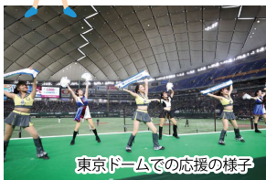
東京ドームでの応援の様子

エイジェックグループは、第95回都市対抗野球大会にて「応援サポート業務」を受託・実施いたしました。