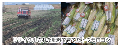
リサイクルされた肥料で育てたトウモロコシ